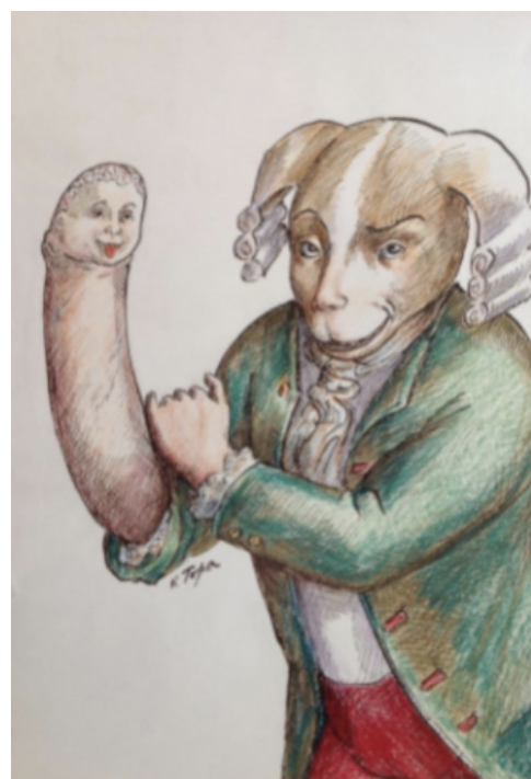
El ventrílocuo José Luis Moreno con sus marionetas Macario, Monchito y Rockefeller. En las cloacas de internet, alguien comentó en un foro: "como no va a ser gay si está todo el día metiendo la mano por el culo a sus marionetas"